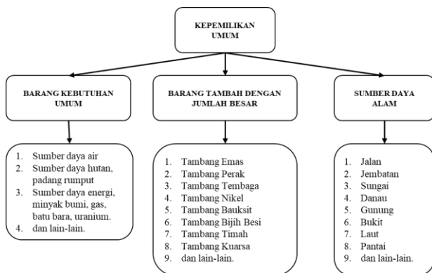
Gambar 1 Skema Kepemilikan Umum Ekonomi Islam

Menurut Triono (2014) kategori kepemilikan umum terdiri dari 3 jenis, meliputi: barang kebutuhan umum, tidak mungkin dimiliki individu, dan bahan tambang dengan jumlah yang besar. Contohnya emas, perak, tembaga, timah, nikel, besik, minyak bumi, dan sebagainya. Islam mengatur agar pengelolaannya diserahkan pada negara dan hasilnya didistribusikan untuk rakyat.